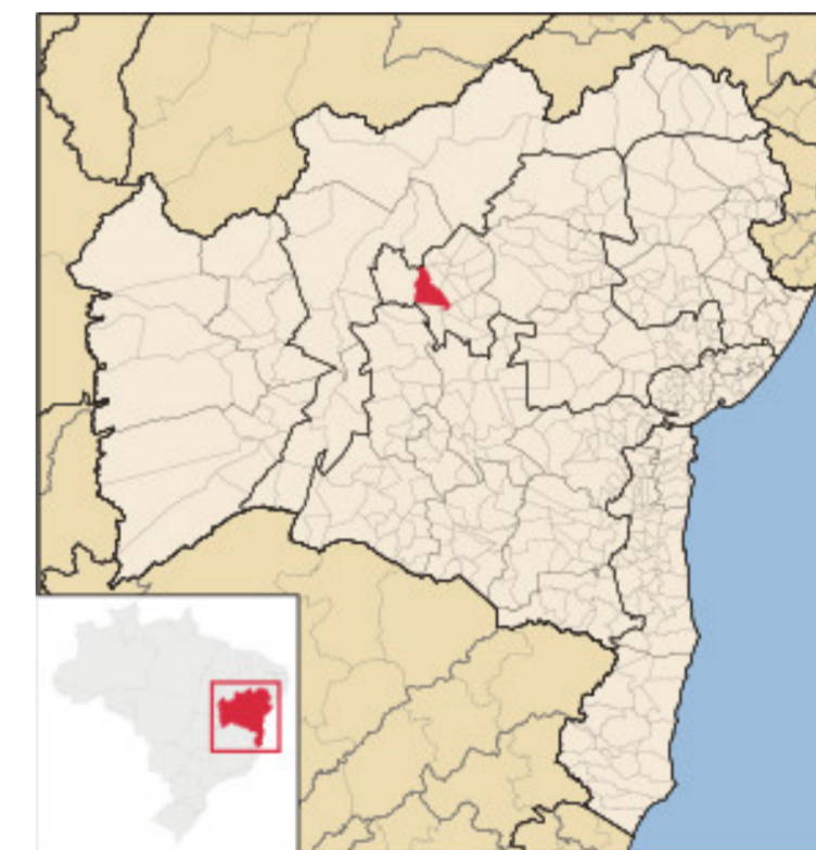
FONTE: GOOGLE / MAPA DE LOCALIZAÇÃO, IBIPEBA NA BAHIA