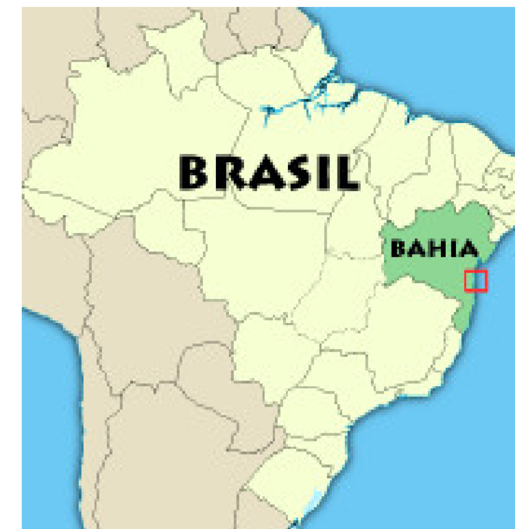
MAPA DE LOCALIZAÇÃO, BAHIA NO BRASIL